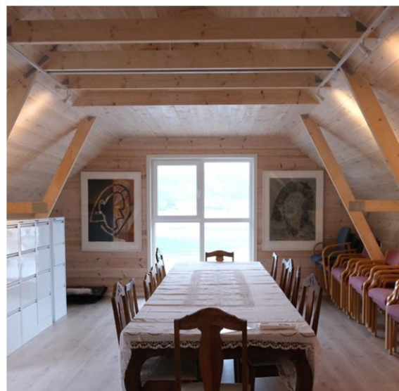
1. Fossvågen med naust i framgrunnen, Fosse-huset bak. Foto: Svein Ove Duesund. 2. Kulturprisen 2022, med illustrasjon av May Linn Clement. 3. Ope møte om forprosjektet 31. august 2024. Foto: Knut Markhus. 4. Gamle Strandebarm barneskule. Foto: Knut Markhus. 5. Sauebilete med Fosse-tekstar ved stien til Haukåsfjellet. Foto: Svein Ove Duesund. 6. Fosse-loftet i Strandebarm Marina. Foto: Knut Markhus